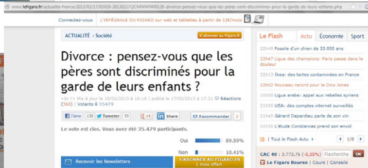
vote | Pensez-vous que les pères sont défavorisés lors d'un divorce ? http://www.leprogres.fr/actualite/2013/02/17/pensez-vous

Connexion | Inscription Le bédouin New Yorker Votre journal en PDF Contactez-nous | Menu